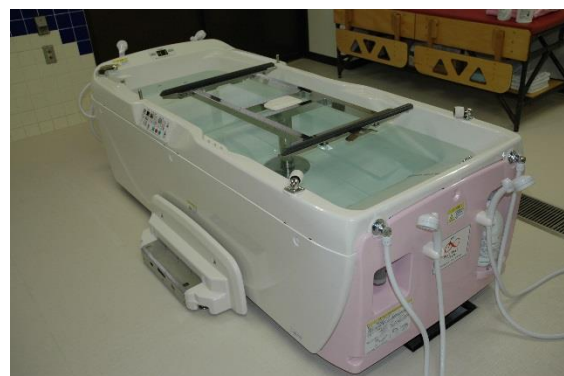
昇降式介護浴槽本体