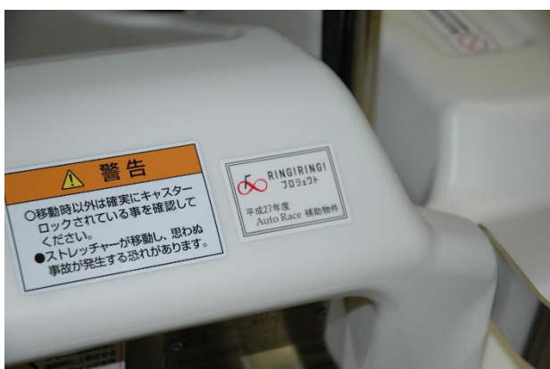
電動昇降ストレッチャー 1 補助標識