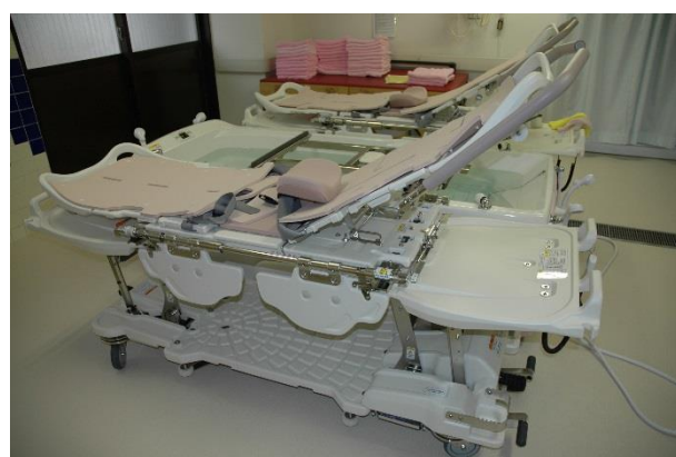
電動昇降ストレッチャー 2