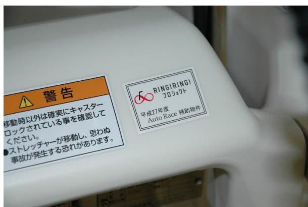
電動昇降ストレッチャー2 補助標識