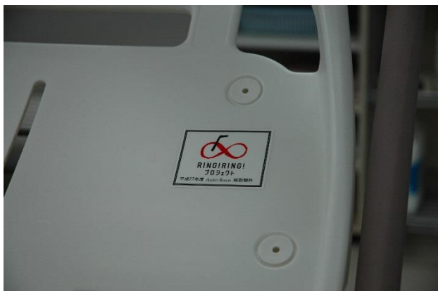
担架 2 補助標識