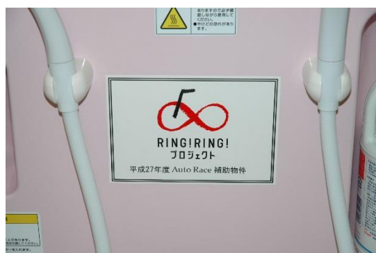
昇降式介護浴槽本体 補助標識