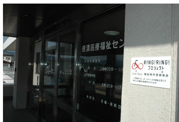
建物入口補助標識