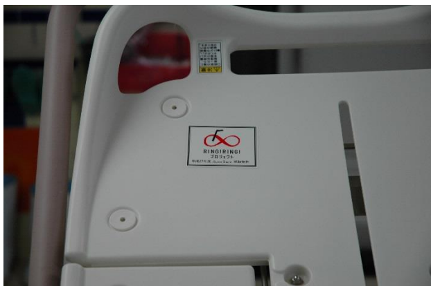
担架 1 補助標識